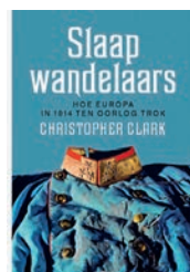
Christopher Clark Slaapwandelaars, hoe Europa in 1914 ten oorlog trok De Bezige Bij, 744 blz., € 25,-