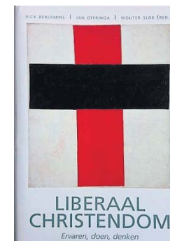
Rick Benjamins, Jan Offringa, Wouter Slob (red.), Liberaal christendom – Ervaren, doen, denken . Uitgeverij Skandalon. Prijs: 21,95 euro (240 blz.).

De grote kracht van geloof zoals het in Liberaal christendom wordt gepresenteerd, is het overstijgen van het eigenbelang en het doen van liefde (in theologische termen: het waar maken van God) in een voortdurend gesprek met de ander. Dat zijn zaken die zeker niet zonder risico zijn, maar waar de wereld vandaag de dag meer dan ooit behoefte aan heeft. Dit mooie en diepzinnige boek geeft een meerstemmige aanzet tot een leven dat op liefde gebaseerd is.